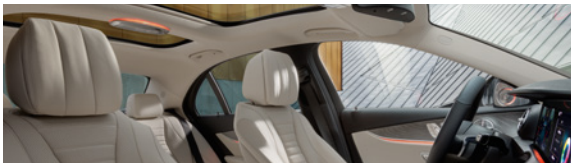
Protection pour l'intérieur et l'extérieur

La Protection Pneus et Jantes Première Classe et la Protection pour l'intérieur et l'extérieur Première Classe sont aussi offertes comme produits autonomes. Le Débosselage sans peinture Première Classe, la Protection Pare-brise et la Protection pour clés sont offerts uniquement en forfaits de protection à couvertures multiples.