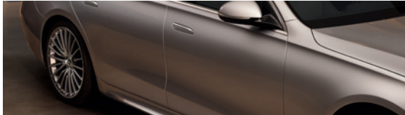
Débosselage sans peinture