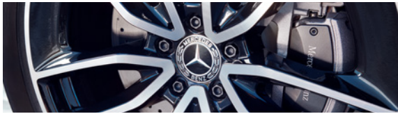
Protection Pneus et Jantes